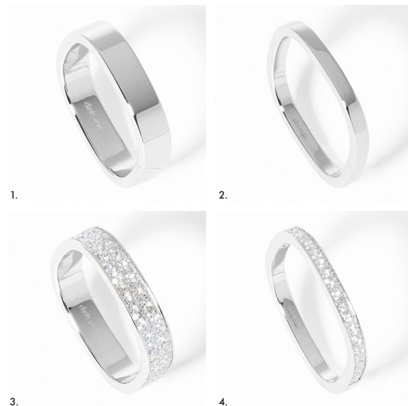
1. Alliance carrée 4mm, platine – 2 300 € • 2. Alliance carrée 2mm, platine – 1 450 € • 3. Alliance carrée 4mm, platine et diamants – 4 300 € • 4. Alliance carrée 2mm, platine et diamants – 2 100 €.

Créée en 1965, l'alliance carrée dinh van incarne l'audace d'un créateur qui a bousculé les codes de la joaillerie dès ses débuts. Jean Dinh Van imagine un anneau à la géométrie inattendue : un carré adouci, épuré, pensé pour vivre au quotidien. Un geste simple, une idée forte — et une signature devenue culte. Pour les amoureux du design et des symboles, l'alliance carrée est bien plus qu'un bijou : c'est une déclaration d'indépendance, un hommage à la liberté d'aimer autrement. Élégante et moderne, elle traverse le temps sans jamais se trahir. Sa forme carrée épouse naturellement le doigt, offrant un confort incomparable — « parce qu'elle n'est pas ronde ». Pratique, elle ne tourne pas ; stable, elle reste fidèle à sa ligne, comme à ses promesses. Le carré, symbole de stabilité et d'équilibre. Une alliance qui, depuis soixante ans, scelle les unions les plus singulières.